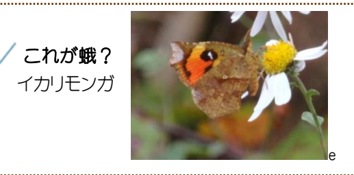
これが蛾? イカリモンガ