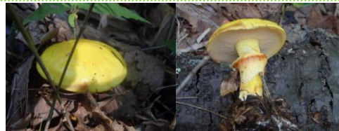
ハナイグチの黄色型 (悦)