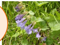
ラショウモンカズラ