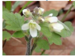
マルバコンロンソウ