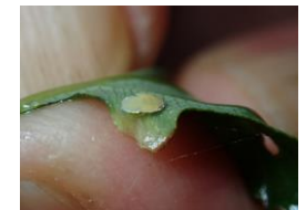
中の住人 クマヤナギトガリキジラミ