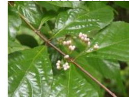
ムラサキシキブ(紫式部)