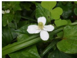
ドクダミ(毒溜・毒痛)