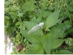
オコトラノオ(丘虎尾)