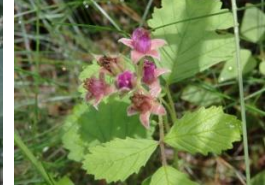
アワブキ(泡吹) ナワシロイチゴ(苗代莓)