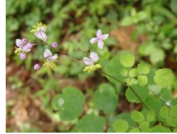
シキンカラマツ(紫錦唐松)