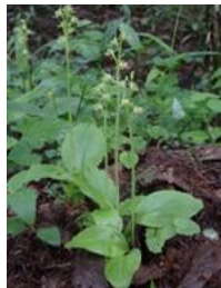
クモキリソウ(雲切草)