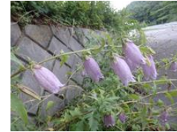
ヤマホタルブクロ(山蛍袋)