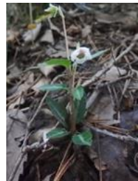
ウメガサソウ(梅笠草)