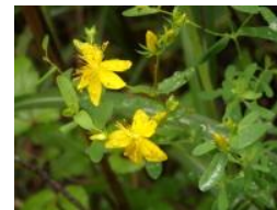
オトギリソウ(弟切草)