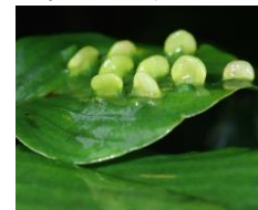
クマヤナギの虫こぶ クマヤナギハフクロフシ