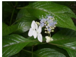
ヤマアジサイ(山紫陽花)