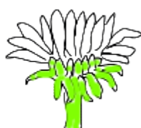
セイヨウタンポポ